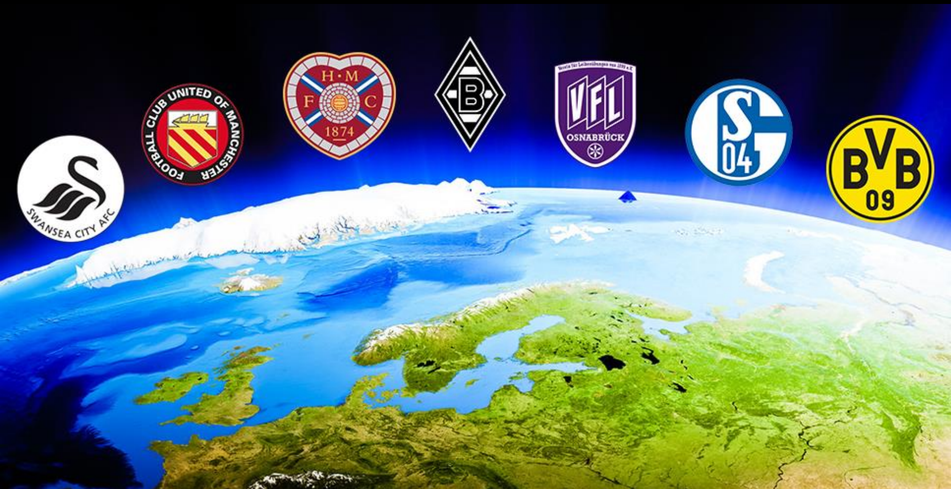
Januari 2016: onderzoek (en bezoeken) bij diverse clubs internationaal