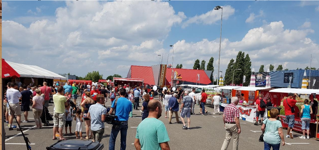
Juli: Actie Twente voor Twente!