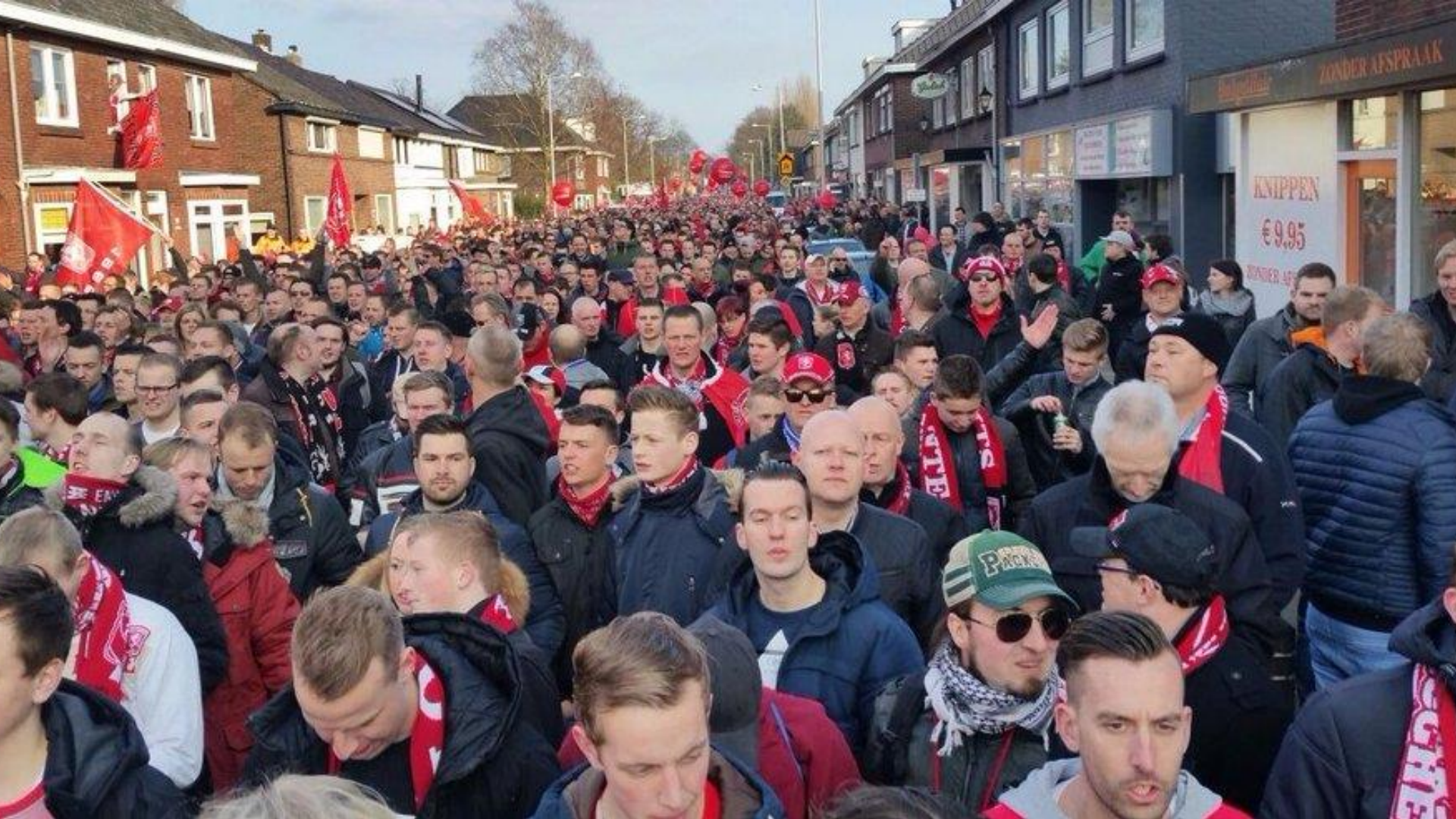
12 maart: Twente Leeft!-mars