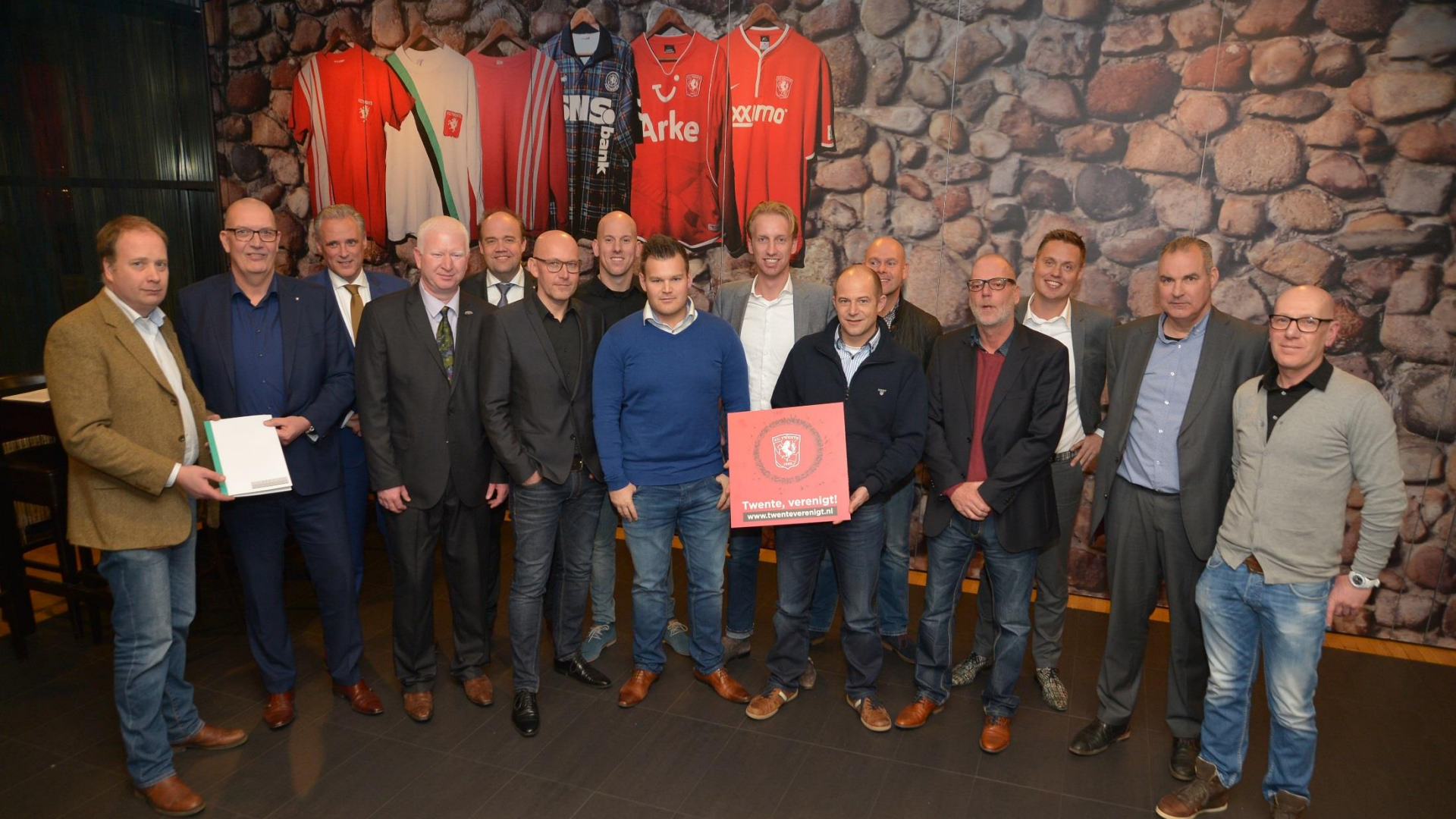
December 2015: eerste samenkomst 14 initiatiefnemers