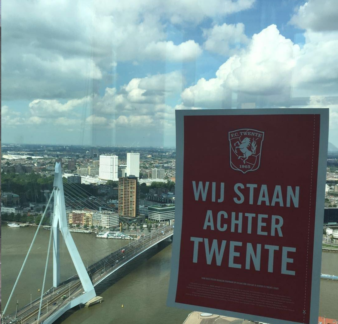
16 juni: posteractie 'Wij staan achter Twente'