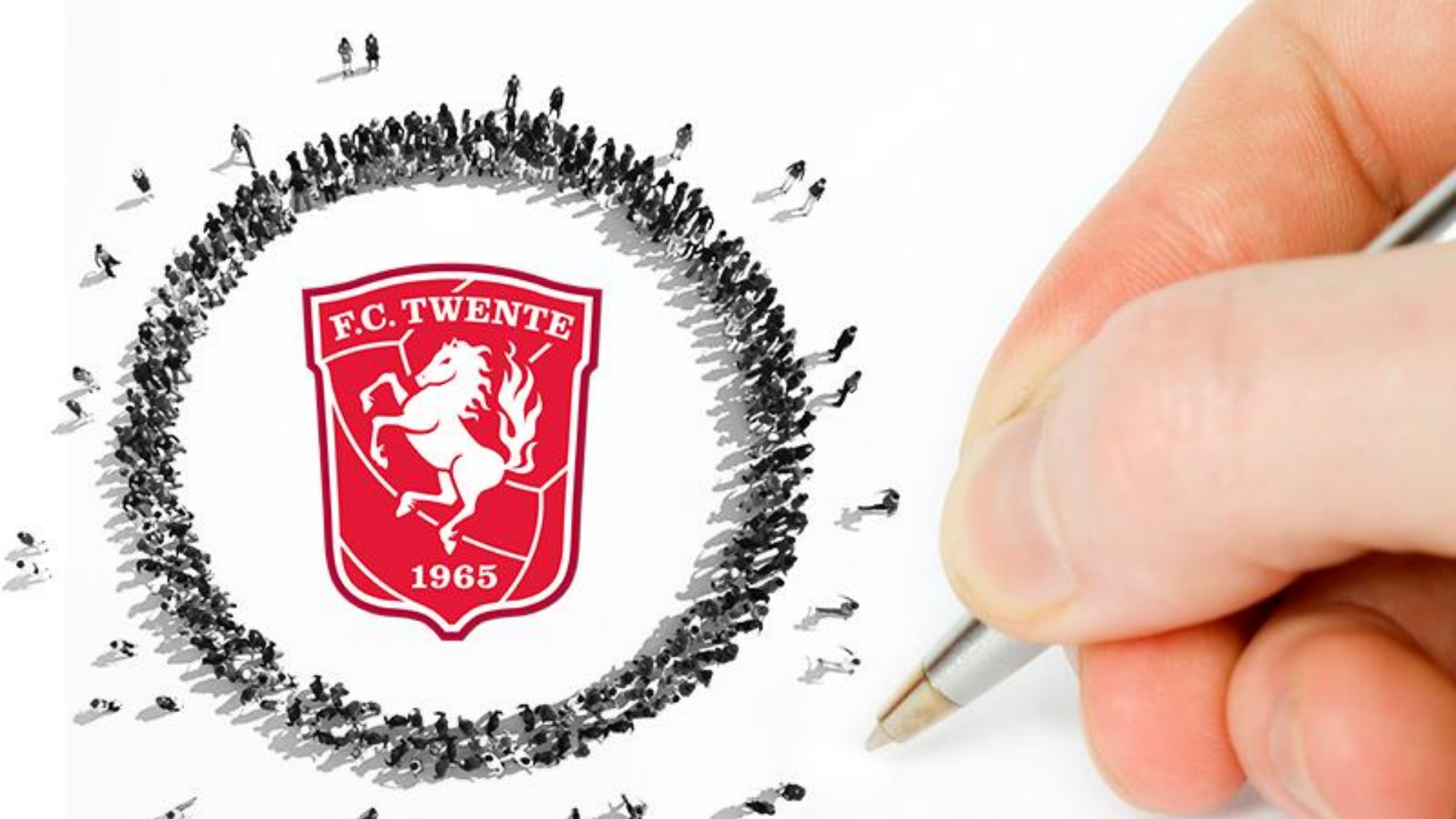
Januari: Open brief aan de Licentiecommissie KNVB, persoonlijk afgeleverd in Zeist