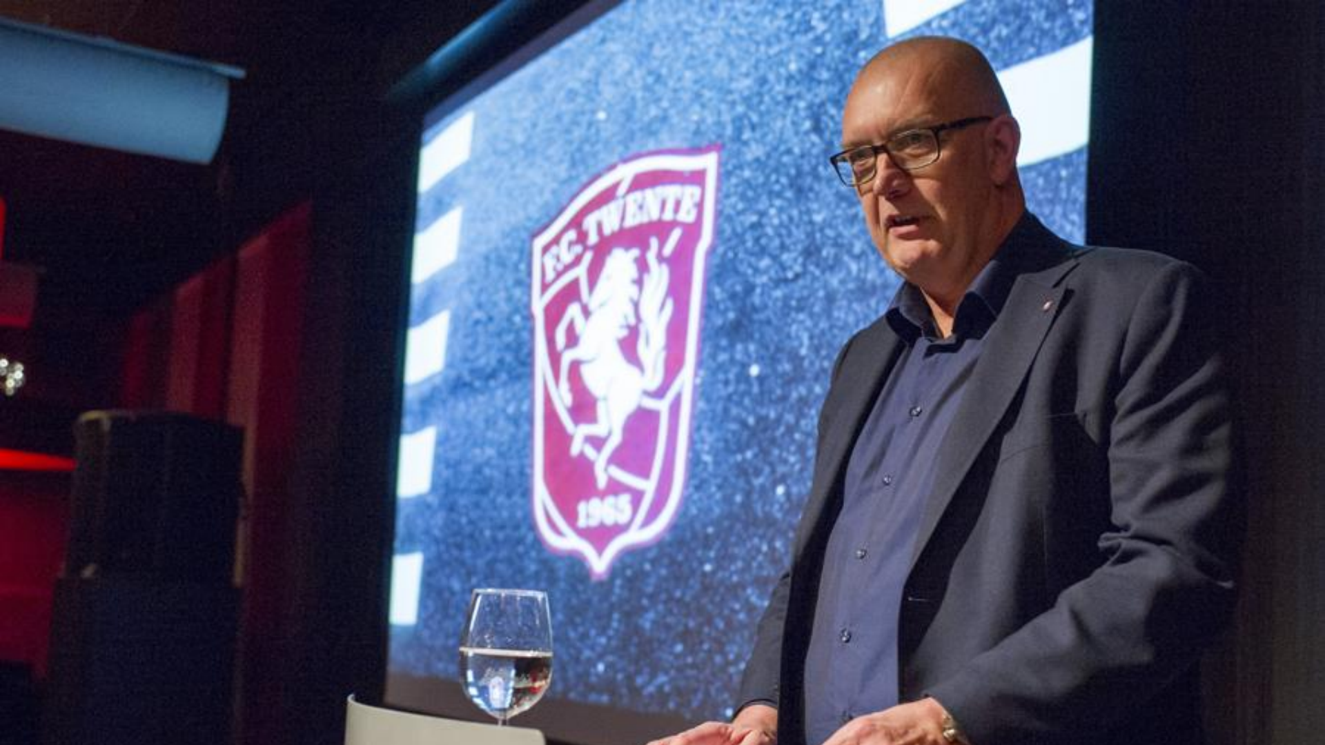
19 januari: bekendmaking Twente, Verenigt! bij nieuwsjaarsreceptie FC Twente