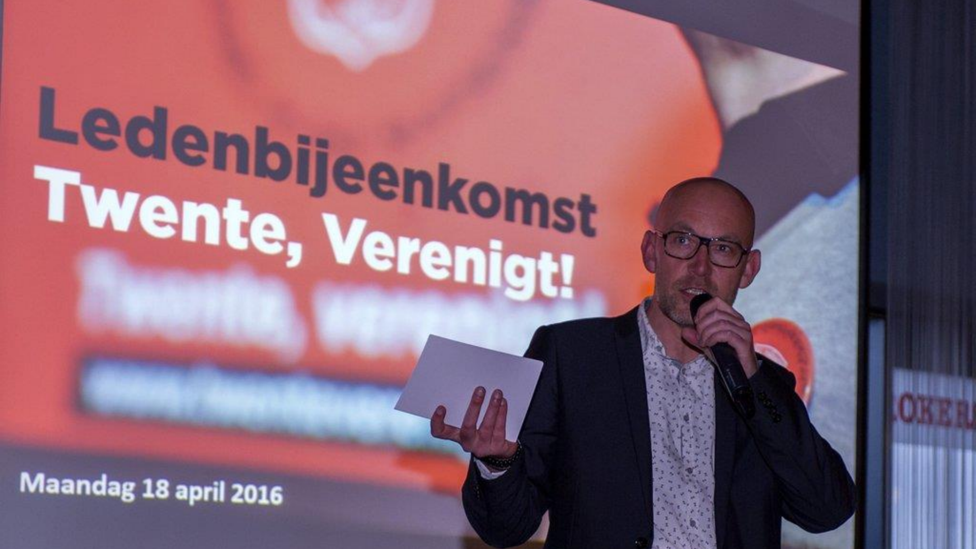
18 april: eerste ledenbijeenkomst Twente, Verenigt!