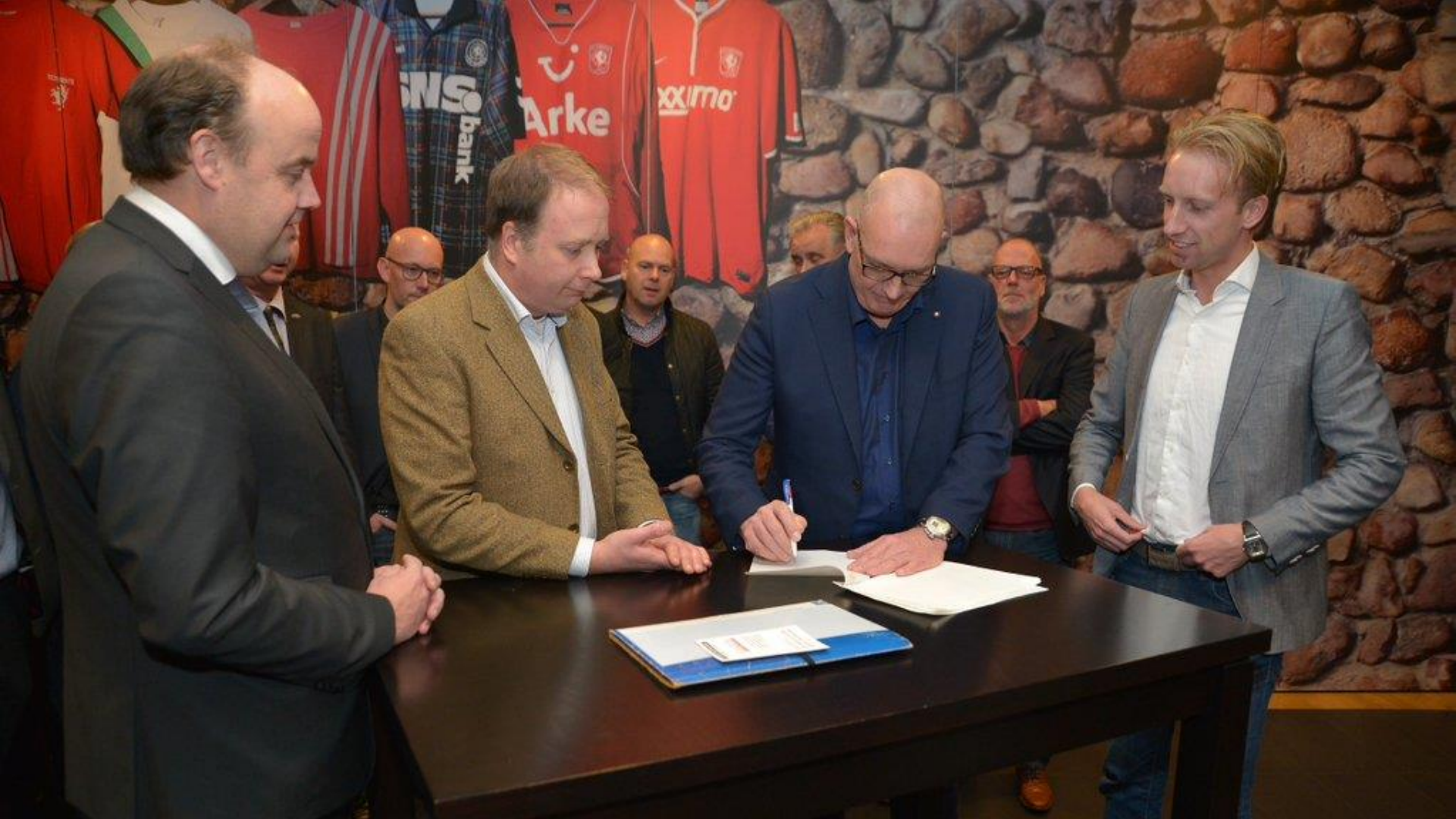
19 januari: ondertekening oprichtingsakte Twente, Verenigt!