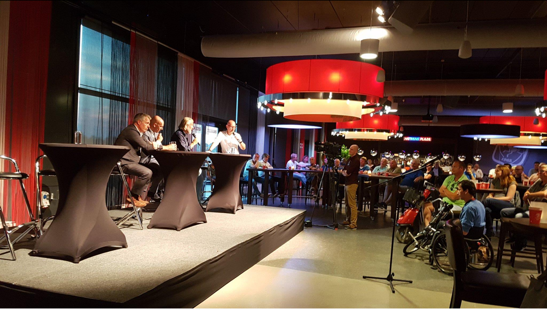
6 september: Supportersavond i.s.m. FC Twente